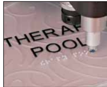
ADA Braille Alfabeti