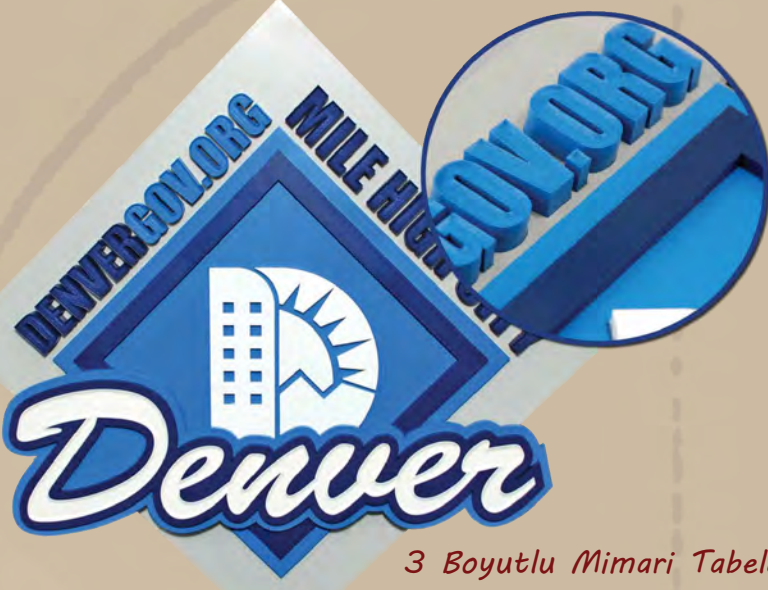
3 Boyutlu Mimari Tabela